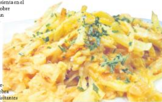
El Bacalao à Brás o a la De

En homenaje a esta gastronomía que ha nacido alrededor del bacalao, presente en todo mercadoillo que se precie, Freixo de Espada à Cinta celebra del 23 al 25 de mayo estas jornadas para que los visitantes disfruten de la comida, de esta villa portuguesa de frontera y de sus impactantes sabores.